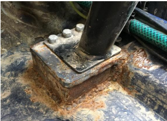
Rohr auf Bodenplatte

Der Überrollbügel darf keinesfalls direkt auf das Chassis aufgeschweißt werden. An den Enden der Rohre muss eine Verstärkungsplatte mit mindestens 3mm und einer Mindestfläche von 8x8cm angeschweißt werden. Idealerweise mit einem Winkel am Holm. Hier 2 Beispielbilder