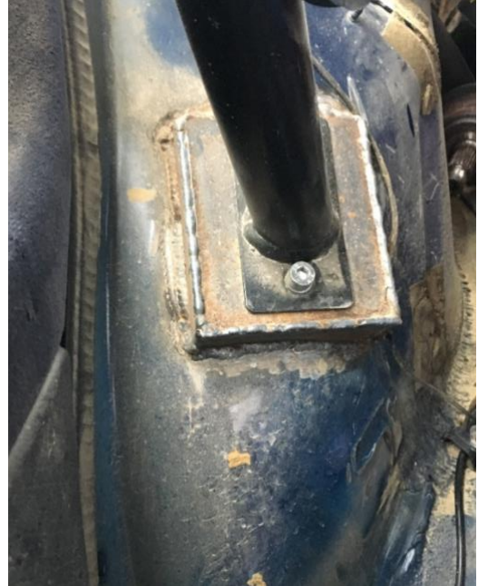
Abstützung ins Heck